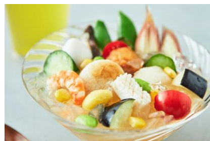
冷やしおでんの夏野菜カクテル