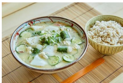
浜の月としかをりを巻の冷や汁