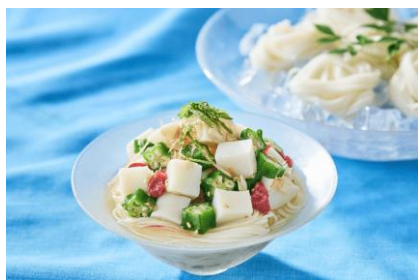
かまぼこと梅オクラのそうめん

鈴廣かまぼこの公式サイトでは、暑い季節でもさっぱり楽しめる、夏にぴったりなアレンジレシピを公開中です。日々の献立やおもてなしメニューとしてもぜひご利用ください。